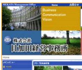
■株式会社 目加田経営事務所 www.21cmc.jp

・ホームページ制作・リニューアル検討中・有効活用したい方は ↓ 無料DEMO受付中