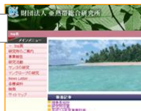
■亜熱帯総合研究所 subtropics.sakura.ne.jp